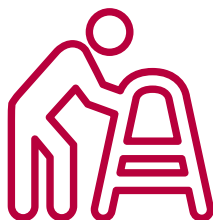
Personnes âgées isolées