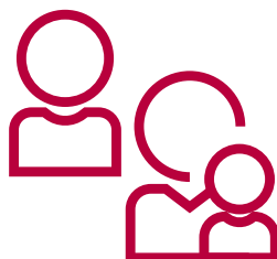
Jeunes / Familles monoparentales

Personnes qui ne sollicitent aucune aide et/ou ne font pas valoir leurs droits, faisant face à des éléments de vulnérabilité additionnelles :